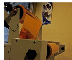
Rebobinador Chromium / Sleeking

Maquina preparada para CHROMIUM / SLEEKING